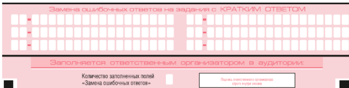
Рис. 9. Область замены ошибочных ответов на задания с кратким ответом

Запрещается записывать ответ в виде математического выражения или формулы. В ответе не указываются названия единиц измерения (градусы, проценты, метры, тонны и т.д.) – так как они не будут учитываться при оценивании. Недопустимы заголовки или комментарии к ответу.